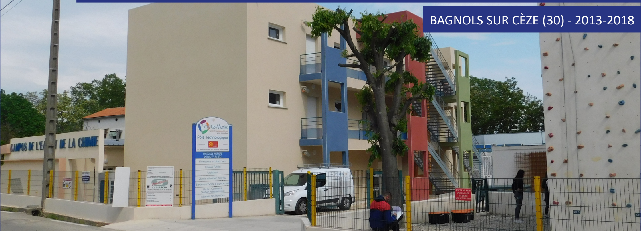
PÔLE TECHNOLOGIQUE. CAMPUS DE LA CHIMIE ET DE L'EAU. HANGAR INDUSTRIEL. MUR D'ESCALADE. PHASAGE DES TRAVAUX.